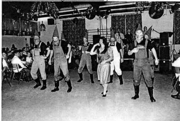
Aus den Nachbargemeinden

Bilder im Internet unter ( www.fotoweb-moenchsroth.de/galerie0021/ ).