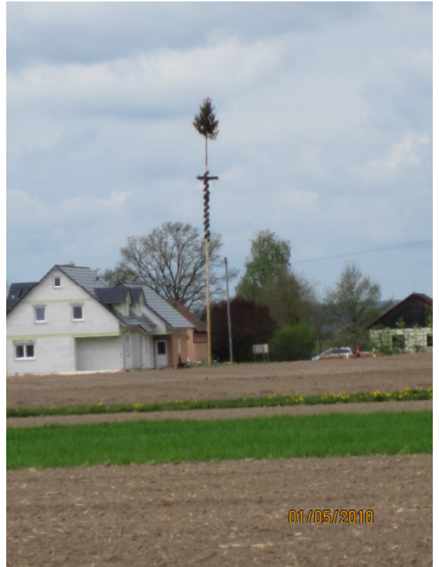
Maibaum in Hasselbach