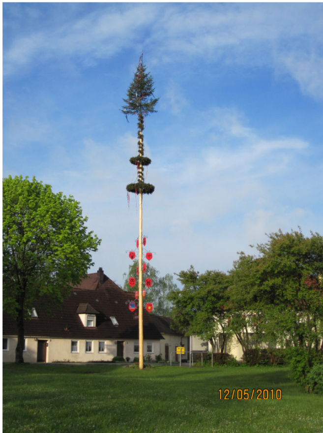
Maibaum in Mönchsroth