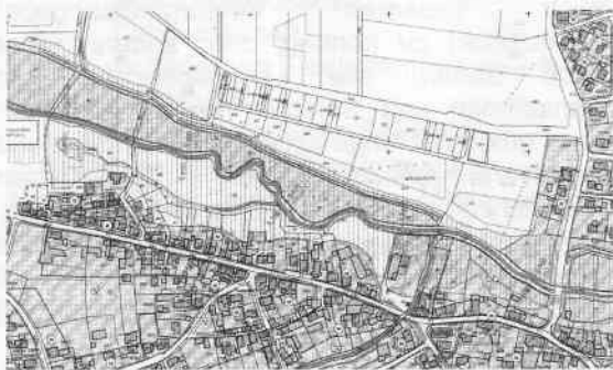
Auszug aus dem Überschwemmungsgebiet nach HQ 100 – Dorfbereich Mönchsroth

Der Entwurf der Überschwemmungsgebietsverordnung mit den dazugehörigen Lageplänen liegt einen Monat vom 22.11.2010 bis 23.12.2010 (einschließlich der genannten Tage) bei der Gemeinde Mönchsroth und in der Verwaltungsgemeinschaft Wilburgstetten während der Dienststunden zur Einsicht auf. Jeder, dessen Belange durch die geplante Rechtsverordnung berührt werden, kann bis spätestens zwei Wochen nach Ablauf der Auslegungsfrist, das ist bis zum 07.01.2011 , bei der Gemeinde Mönchsroth oder beim Landratsamt Ansbach - Sachgebiet Wasserrecht - Crailsheimstraße 1, 91522 Ansbach, schriftlich oder zur Niederschrift etwaige Bedenken oder Anregungen gegen die geplante Rechtsverordnung erheben.