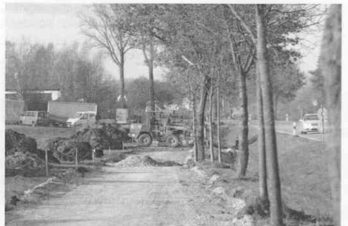
Radwegtrasse Ortseingang Mönchsroth