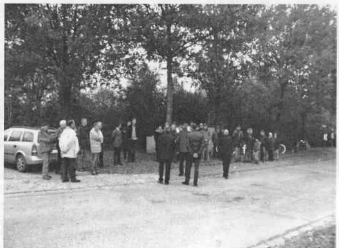
Bürgerinnen und Bürger anl. des 1.Spatenstich